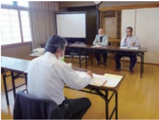
令和7年度（令和8年度実施）審査会の様子