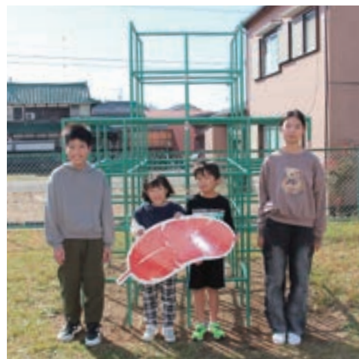
（令和7年度実績例）舟津区のジャングルジム新設

上記助成事業に関するお問い合わせは、あわら市社会福祉協議会（☎73-2253）まで