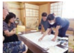
▼菅野区：見守り防災マップづくりを実施。防災グッズの体験も行いました。