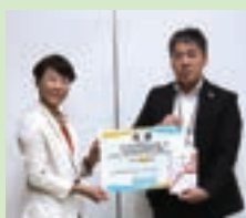
▲明治安田生命様 福井鋸螺様▶