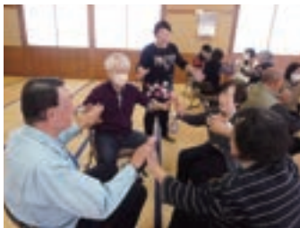
▲山室区：シナプソロジーを皆さんで楽しみました。

あわら市社会福祉協議会では、地域の皆さんがいつまでも元気に自宅で暮らせるよう、介護予防や困りごとの手助けなどを行うなど、ご近所さんで支え合うための活動として「福祉委員会」の立ち上げを支援しています。2013年から始まったこの活動は、あわら市内でこれまで39地区が立ち上げています。