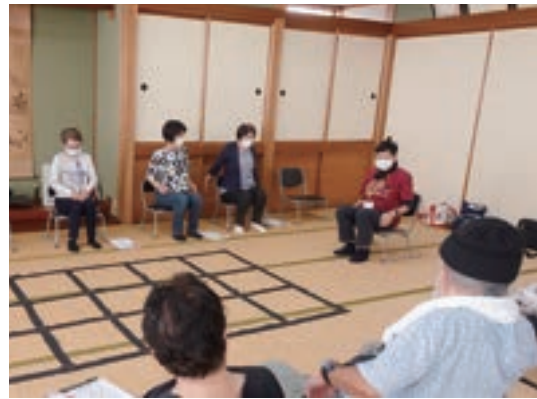
（令和7年度実績例）あわら脳活クラブ