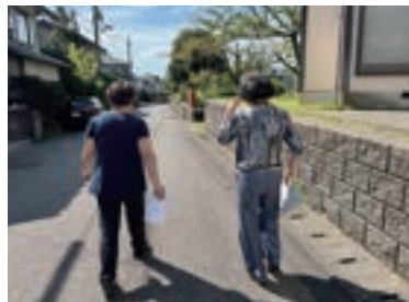
▲向ヶ丘区：定期的に情報共有や見守りを行っています。不在のところには手書きの手紙を残します。